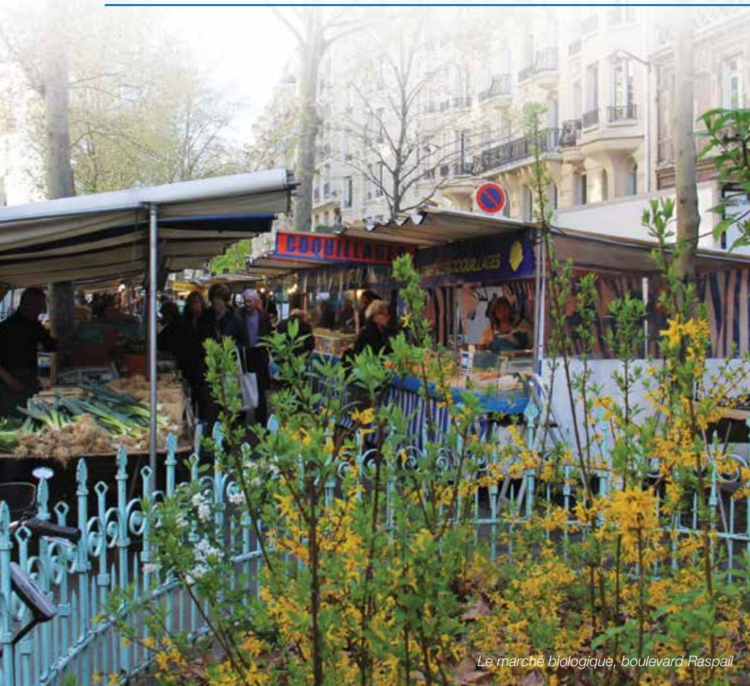
Le marché biologique, boulevard Raspail

Le nouveau Conseil de Quartier « Rennes » s'est réuni le 4 décembre 2014.