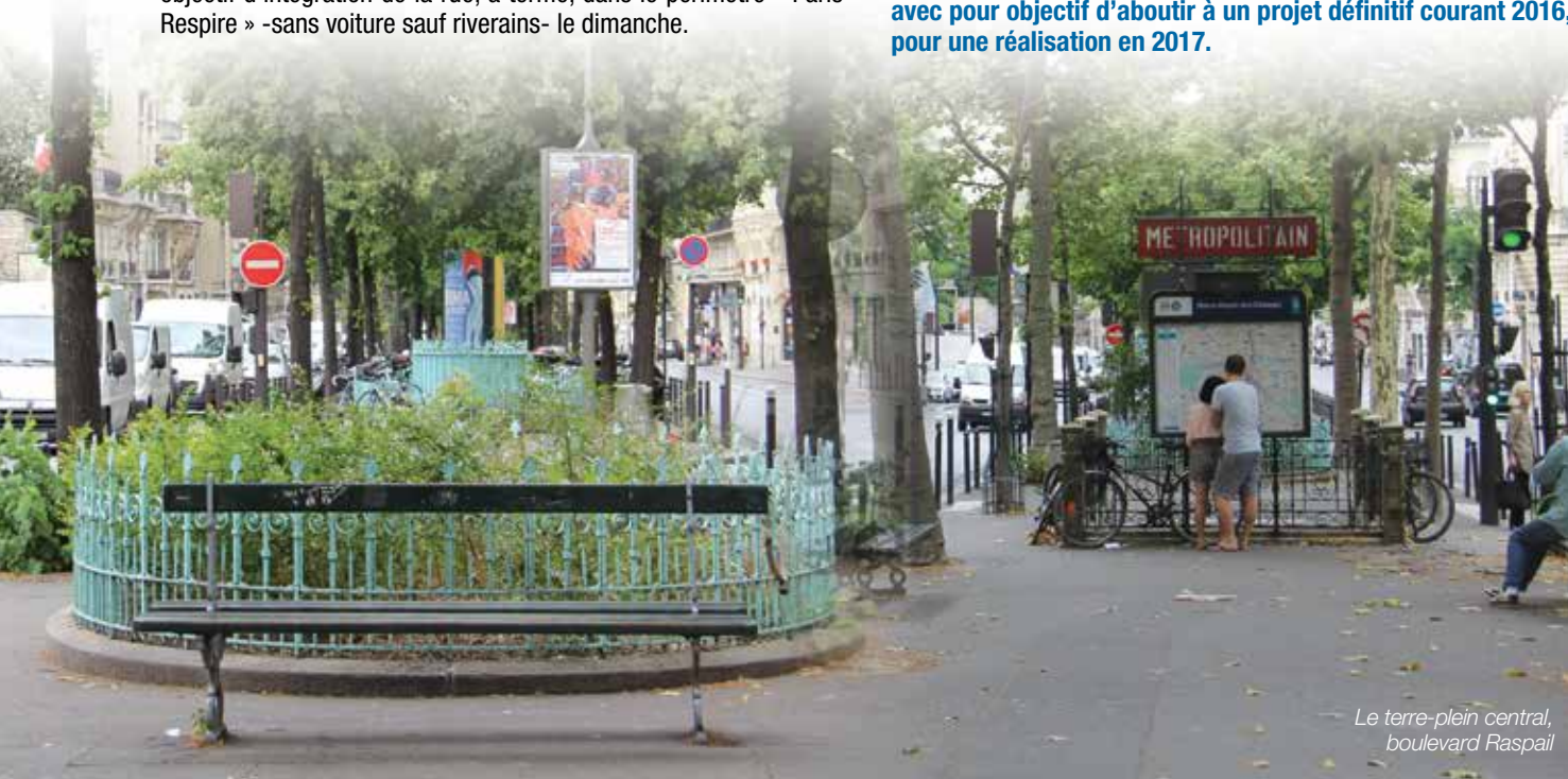
Le terre-plein central, boulevard Raspail

Le projet du boulevard Raspail étant relativement important (550 000 euros de budget), un groupe de travail sera constitué avec pour objectif d'aboutir à un projet définitif courant 2016, pour une réalisation en 2017.