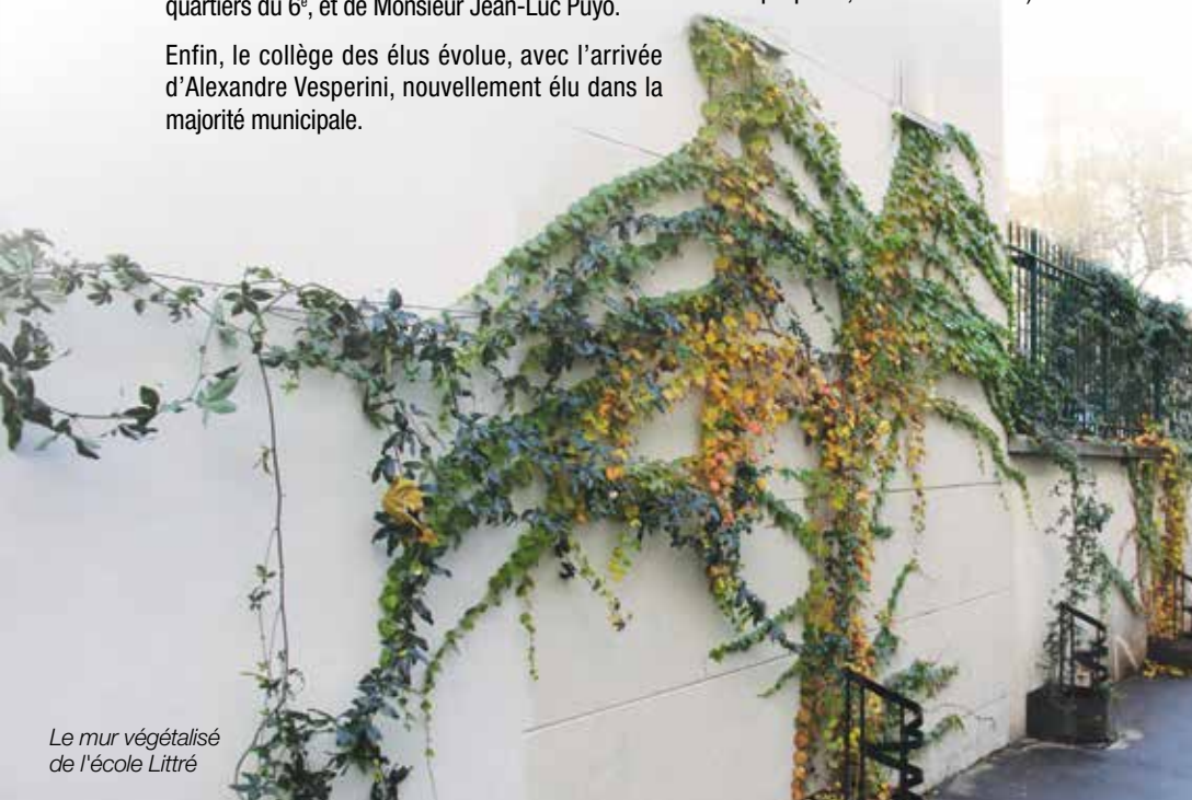
Le mur végétalisé de l'école Littré

Cette réunion du 10 novembre 2014 a été l'occasion de dresser de nouvelles pistes d'action. Ces dernières s'orientent principalement dans trois directions : premièrement, demeurer un acteur de la vie locale au quotidien, ce qui passe par la multiplication des signalements (problèmes de voirie, malpropreté, avenir de certains bâtiments et équipements...); deuxièmement, améliorer le lien social et renforcer l'esprit village de Saint-Placide (soutien aux événements festifs et initiation de nouvelles opérations, suivi des activités associatives et envoi de mails sur la vie du quartier...); troisièmement et enfin, mieux faire connaître le fonctionnement de la démocratie parisienne et des services de la Mairie de Paris, afin de donner aux habitants les clés pour participer concrètement à l'amélioration de la vie du quartier (rencontres et prises de contact avec les responsables de la voirie et de la propreté, visites de site...).