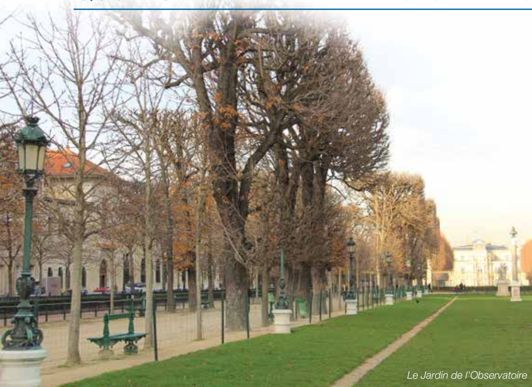
Le Jardin de l'Observatoire

Du fait des élections municipales de mars 2014, il n'y a pas eu de réunion de fin de mandature. Néanmoins à l'initiative de notre Conseil de Quartier des investissements ont été réalisés.