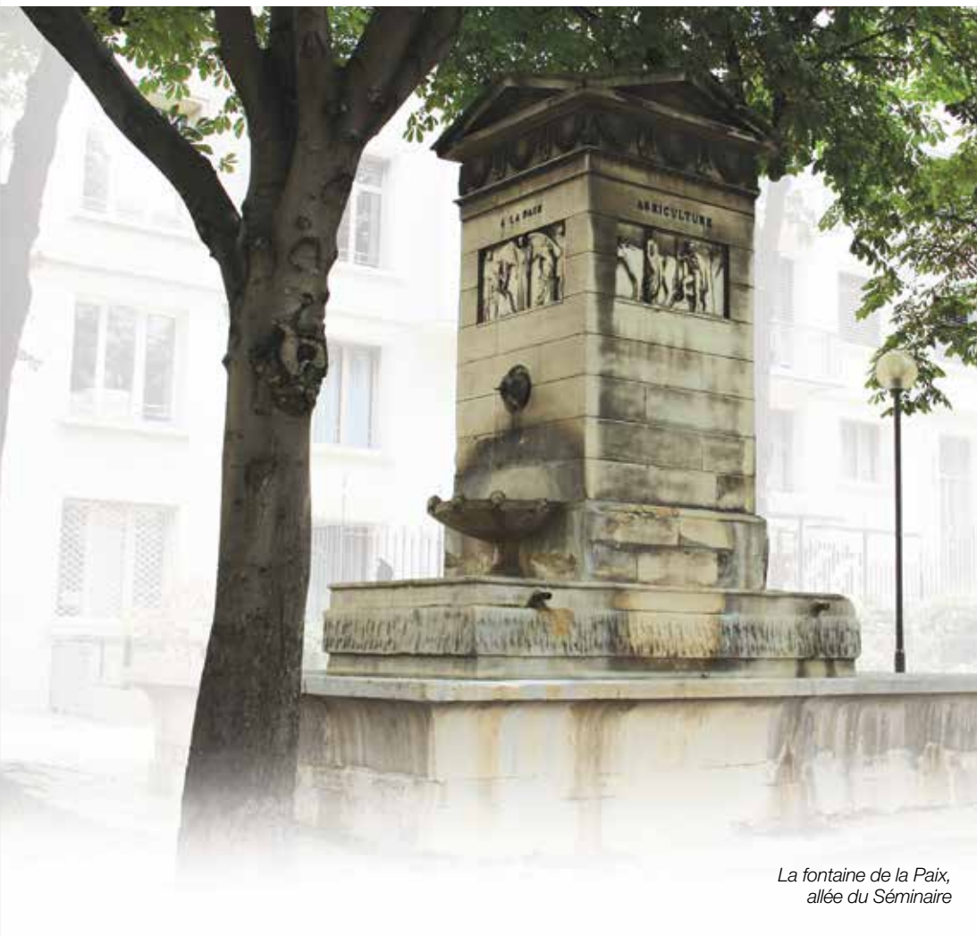
La fontaine de la Paix, allée du Séminaire

Rappelons enfin la participation des membres du Conseil au Vide-Greniers des 13 et 14 septembre 2014.